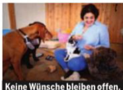
Keine Wünsche bleiben offen.

Bez. St. Pölten. Inmitten des idyllischen Wienerwaldes erwartet Hunde in Altengbach ein mit viel Liebe revitalisiertes, traditionsreiches Landhaus aus dem 19. Jahrhundert. Eine 3.000 Quadratmeter große Freilauffläche mit unterschiedlichen Ruhe- und Erlebniszonen lädt zum Spielen und Entspannen ein. Neben den selbstverständlichen täglichen Spaziergängen werden ge-