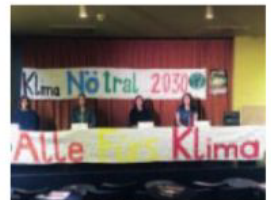
Kreative Schilder gewünscht.